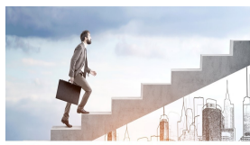
L'IMPRESA INN-FORMATA - LA FORMAZIONE CHE INNOVA LE IMPRESE VENETE

L'IMPRESA INN- FORMATA LA FORMAZIONE CHE INNOVA LE IMPRESE VENETE